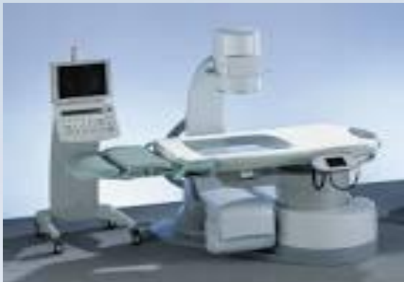
واحد آموزش سلامت